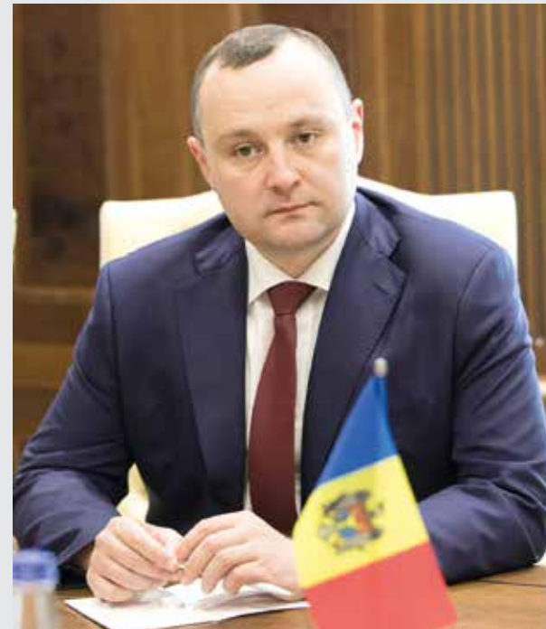
тралитета Молдовы, развитие социального государства.

Члены Блока должны разделять несколько принципов: соблюдение суверенитета и ней-