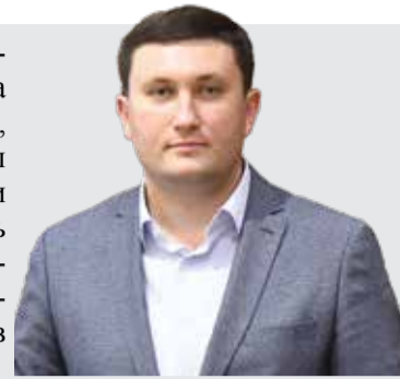
Гайк Вартанян, депутат Парламента РМ

Политизация процесса вакцинации приводит к печальным последствиям, когда люди теряют доверие ко всем вакцинам, что влияет на здоровье нации. Мы должны сотрудничать со всеми производителями вакцин. Мы, политики, должны помогать медикам в вопросах правильного информирования по вакцинации. Мы должны сотрудничать со всеми производителями вакцин., в том числе организовать закупки вакцин.