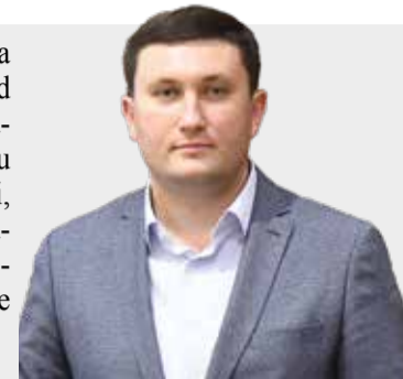
Gaik Vartanean, deputat în Parlament

Politizarea procesului de vaccinare duce la consecințe grave, deoarece oamenii își pierd încrederea în toate vaccinurile, ceea ce afectează sănătatea națiunii. Trebuie să conlucrăm cu toți producătorii de vaccinuri. Noi, politicienii, trebuie să ajutăm medicii referitor la informarea corectă privind vaccinarea. Trebuie să cooperăm cu toți producătorii, inclusiv în ceea ce privește achiziționarea de vaccinuri.