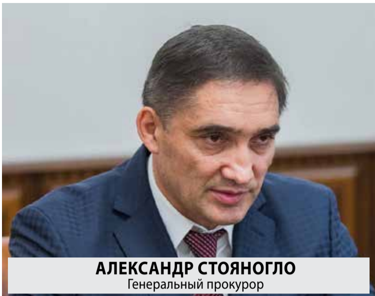
АЛЕКСАНДР СТОЯНОГЛО Генеральный прокурор