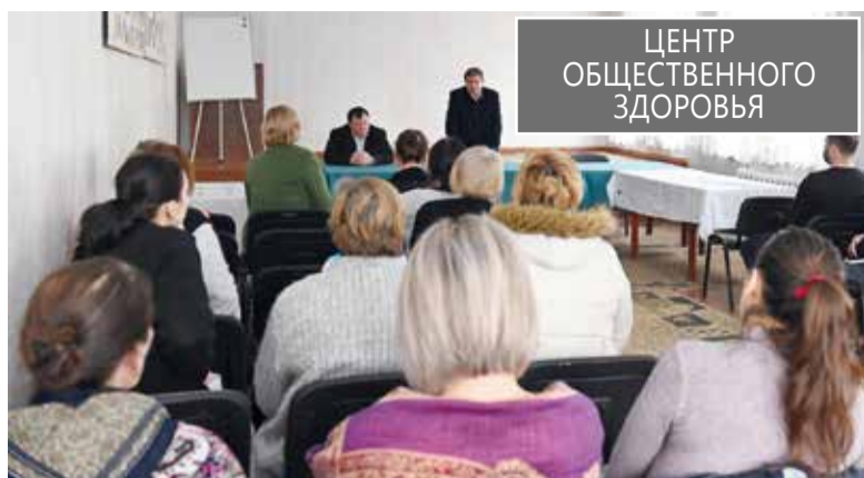
ЦЕНТР ОБЩЕСТВЕННОГО ЗДОРОВЬЯ