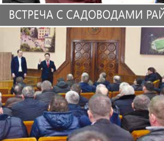
ВСТРЕЧА С САДОВОДАМИ РАЙОНА