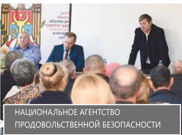
НАЦИОНАЛЬНОЕ АГЕНТСТВО ПРОДОВОЛЬСТВЕННОЙ БЕЗОПАСНОСТИ