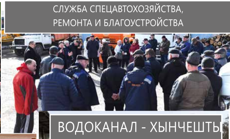
СЛУЖБА СПЕЦАВТОХОЗЯЙСТВА, РЕМОНТА И БЛАГОУСТРОЙСТВА