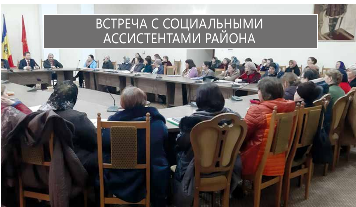
ВСТРЕЧА С СОЦИАЛЬНЫМИ АССИСТЕНТАМИ РАЙОНА