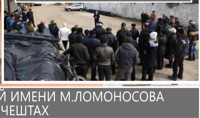
ЛИЦЕЙ ИМЕНИ М.ЛОМОНОСОВА В ХЫНЧЕШТАХ