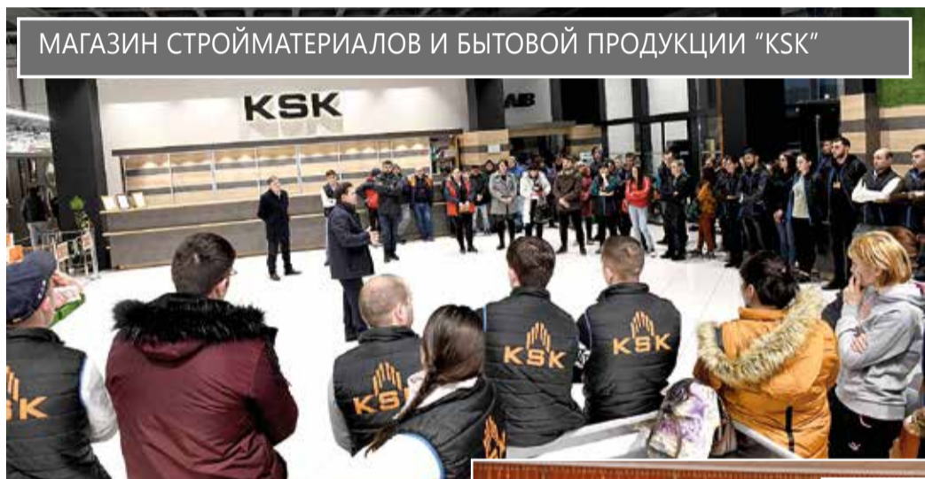
МАГАЗИН СТРОЙМАТЕРИАЛОВ И БЫТОВОЙ ПРОДУКЦИИ "KSK"