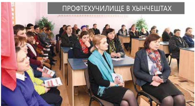
ПРОФТЕХУЧИЛИЩЕ В ХЫНЧЕШТАХ