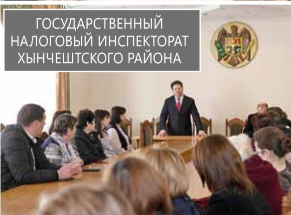
ГОСУДАРСТВЕННЫЙ НАЛОГОВЫЙ ИНСПЕКТОРАТ ХЫНЧЕШТСКОГО РАЙОНА