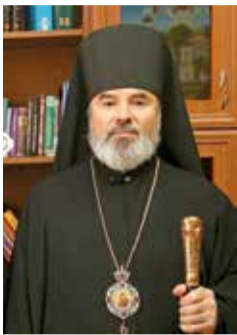
Episcop de Bălți și Fălești, Marchel

Pilonii pe care se ține viața societății moldovenești, pământul, limba, poporul – toate acestea se pun la îndoială de unii politicieni rău intenționați. Atât din afara țării, cât și din interiorul său. Să anulezi dreptul oamenilor de a vorbi limba care pentru ei, deseori chiar nefiind de naționalitate rusă, a devenit limbă natală, este o modalitate de a trezi în oameni nemulțumirea. Sînt convinși că problema restricționării drepturilor limbii ruse va avea rezultate mult mai devastatoare decît credem noi. Este vorba despre generațiile în creștere, lipsite în mod forțat de limba rusă. Și destinul acestora este de a fi marginalizați, deoarece Moldova este legată de Rusia prin mai multe căi, unul dintre care este și limba rusă.