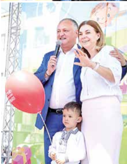
Igor Dodon, președintele RM

Deși în ultimele decenii familiile din Republica Moldova se confruntă cu multiple probleme de ordin social și economic, trebuie să facem tot posibilul ca să transmitem acest model al societății generațiilor următoare, deoarece doar protejind familia vom putea rezista ca neam, ca țară. Adresez sincere felicitări cu prilejul Zilei Internaționale a Familiei, care e sărbătorită azi, 15 Mai. Le doresc tuturor să se bucure de familii împlinite, cu copii și părinți sănătoși, de realizări frumoase, pace și liniște sufletească.