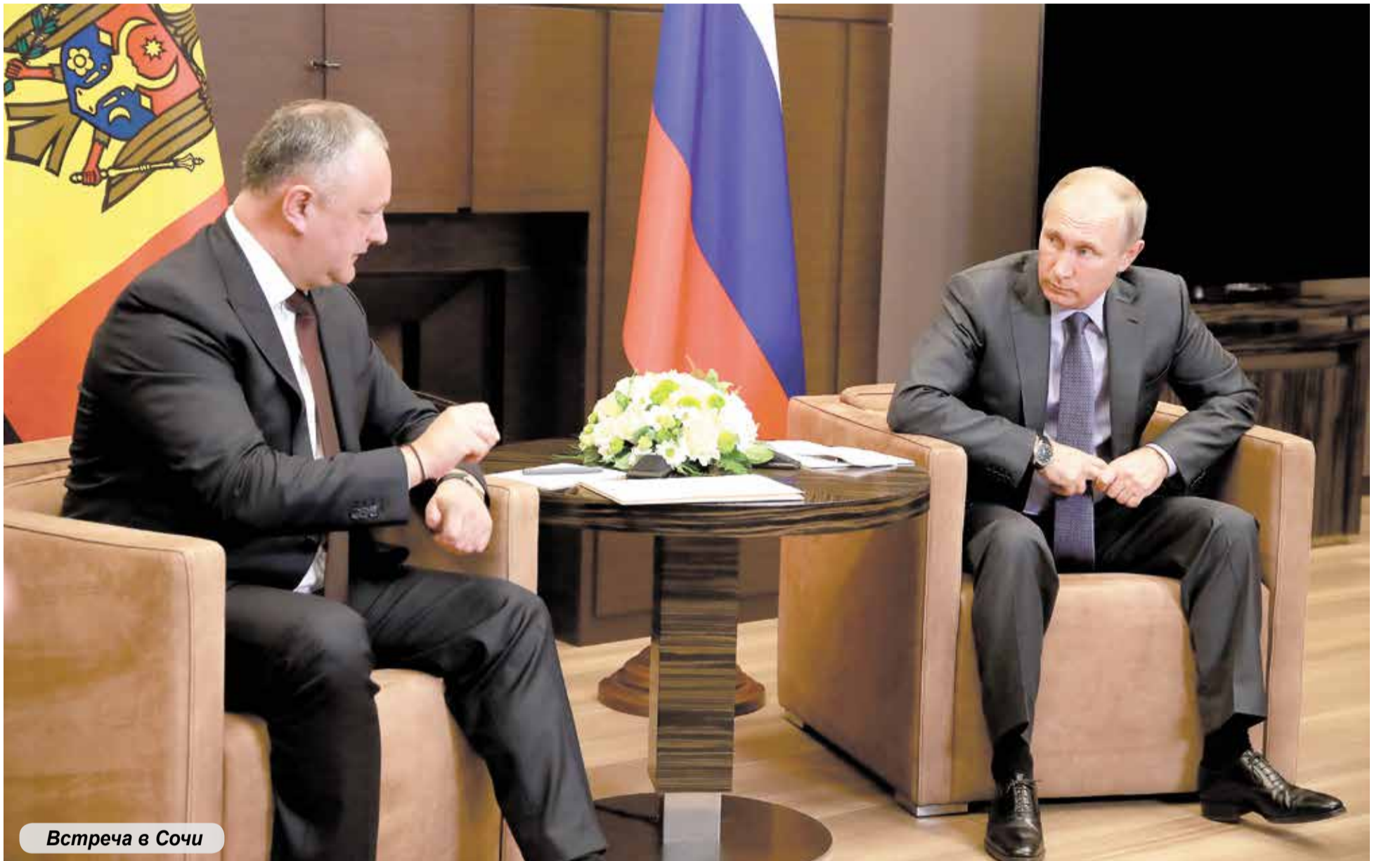
Встреча в Сочи

Игорь Додон и Владимир Путин обсудили ход выполнения ранних договоренностей и наметили новые направления сотрудничества. В ходе встречи Президент Молдовы еще раз поблагодарил российского лидера за ряд положительных решений по экспорту молдавской продукции на российский рынок и по амнистии для трудовых мигрантов.