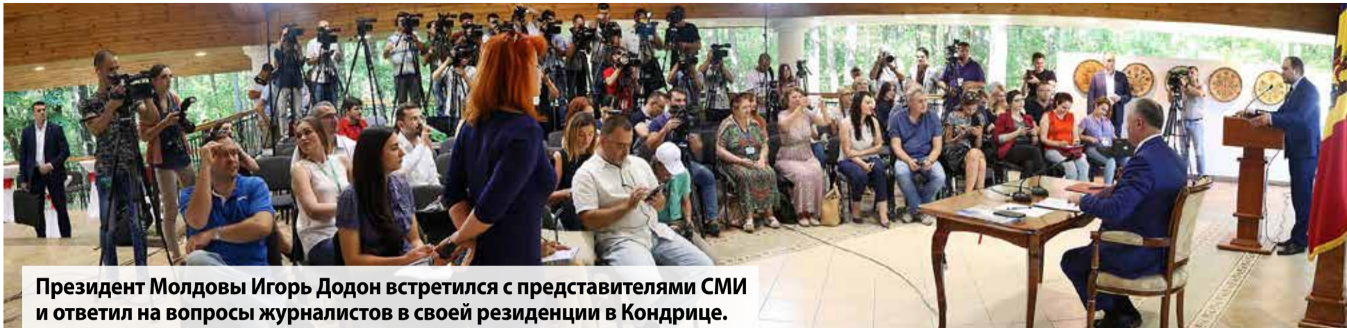
Президент Молдовы Игорь Додон встретился с представителями СМИ и ответил на вопросы журналистов в своей резиденции в Кондрице.