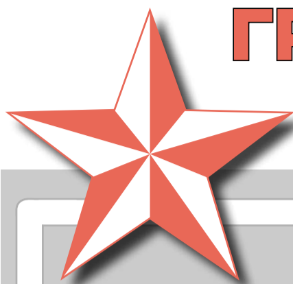
ГРАФИК ВСТРЕЧ ГРАЖДАН С ДЕПУТАТАМИ ПСРМ