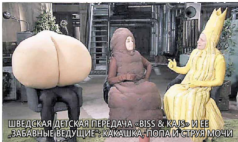
ШВЕДСКАЯ ДЕТСКАЯ ПЕРЕДАЧА «BISS & Kajs» И ЕЕ «ЗАБАВНЫЕ ВЕДУЩИЕ»: КАКАШКА, ПОПА И СТРУЯ МОЧИ

Добро пожаловать в «Толерантность». Добро пожаловать в Европу.