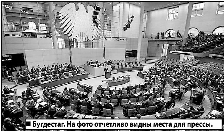
■ Бугдестаг. На фото отчетливо видны места для прессы.

Первое пленарное заседание весенне-летней сессии парламента началось 13 февраля в наполовину восстановленном здании законодательного органа Республики Молдова. После того, как в борьбе за демократию его разграбили и сожгли, на ремонт и закупку нового оборудования с 2009 года было потрачено более 300 миллионов леев.