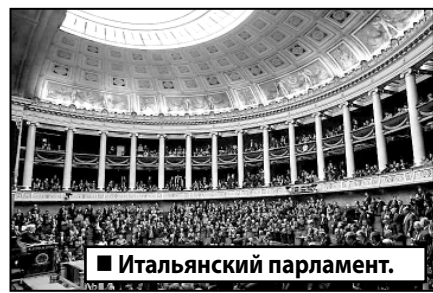
■ Итальянский парламента.