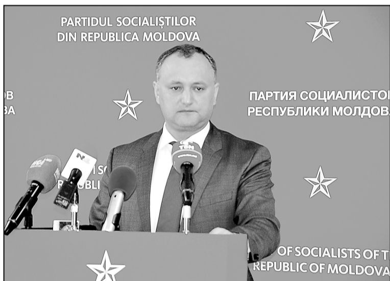
3 февраля 2014 г. председатель Партии социалистов Республики Молдова Игорь ДОДОН провел пресс-конференцию, в ходе которой выступил с инициативой проведения консультативных референдумов по вопросу вступления в Таможенный союз во всех районах и муниципиях Молдовы.

Как отметил лидер ПСРМ, Верховный закон государства – Конституция, а также иные международные нормативные акты предусматривают право народа на самовыражение по самым важным вопросам общества в ходе всенародного опроса.