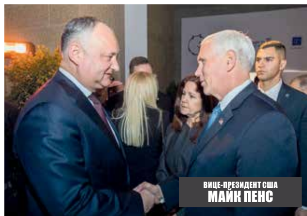
ВИЦЕ-ПРЕЗИДЕНТ США МАЙК ПЕНС