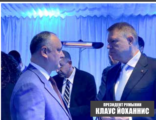
ПРЕЗИДЕНТ РУМЫНИИ КЛАУС ИОХАННИС