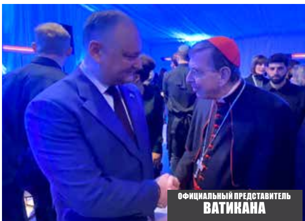
ОФИЦИАЛЬНЫЙ ПРЕДСТАВИТЕЛЬ ВАТИКАНА