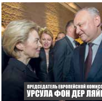
ПРЕДСЕДАТЕЛЬ ЕВРОПЕЙСКОЙ КОМИССИИ УРСУЛА ФОН ДЕР ЛАЙЕН

Игорь Додон заверил председателя Еврокомиссии в приверженности руководства РМ обязательствам, взятым в рамках курса на европейскую интеграцию, включая подписанные международные соглашения, и заявил о продолжении курса на взвешенную внешнюю политику Республики Молдова.