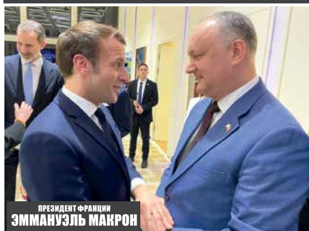
ПРЕЗИДЕНТ ФРАНЦИИ ЭММАНУЭЛЬ МАКРОН