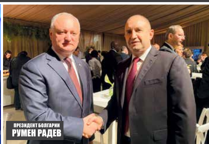
ПРЕЗИДЕНТ БОЛГАРИИ РУМЕН РАДЕВ