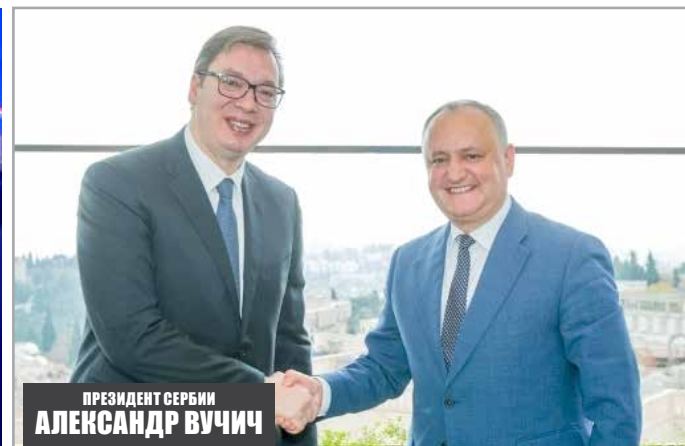
ПРЕЗИДЕНТ СЕРБИИ АЛЕКСАНДР ВУЧИЧ

Парламент Республики Молдова 26 ноября 2015 года принял решение объявить 27 января официальным Днем памяти жертв Холокоста.