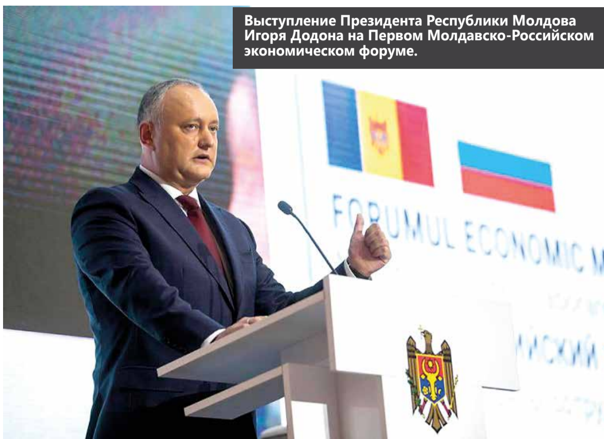
Выступление Президента Республики Молдова Игоря Додона на Первом Молдавско-Российском экономическом форуме.

К большому сожалению, мы все еще не достигли даже того уровня развития, который был у Молдовы до распада Советского Союза. Наш ВВП по итогам 2017 года составил лишь 74% от ВВП 1989 года. ВВП на душу населения – чуть более 2 тыс. долларов США,