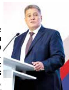
Георгий БООС, экс-губернатор Калининградской области, президент корпорации «БЛ ГРУПП»

Сегодня у Молдовы появился исторический и уникальный шанс стать мостом между двумя мега-рынками западноевропейских и евразийских стран. В условиях глобализации мир сегодня развивается мега-рынками, и дальше они уже взаимодействуют между собой. Учитывая, что с этого пространства, возможно уже даже на долгие годы, ушли прибалтийские государства, у которых был такой шанс. В первую очередь у Литвы был такой шанс. Учитывая это обстоятельство, сегодня есть такой шанс у Молдовы. Тем более, что президент Молдовы одновременно проводит политику по многовекторному развитию отношений с западноевропейскими и евразийскими странами.