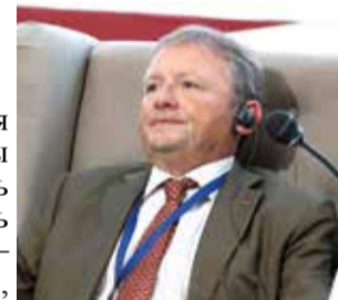
Борис ТИТОВ, уполномоченный при Президенте Российской Федерации по защите предпринимателей

В форуме приняла участие очень внушительная делегация представителей российского бизнеса. Президенту Молдовы Игорю Додону удалось заинтересовать их, показать инвестиционную привлекательность Молдовы. Здесь собрались представители очень широкого круга отраслей – сельское хозяйство, производство потребительских товаров, банки, туризм и многие другие, и все они заинтересованы в инвестициях. Мы говорим не о десятках, а о сотнях миллионов инвестиций, потому что все проекты, которые могут быть реализованы, очень значительные. И это не только торговые связи, что очень важно. Мы за присутствие высоких молдавских вин на нашем рынке, но поставки базового вина тоже необходимы, это огромный прибыльный бизнес. России также выгодны инвестиции в эту и другие отрасли. Потенциал Молдовы с точки зрения взаимоотношений с Россией очень высок. Молдова станет самой выгодной страной для инвестиций только в том случае, если она будет открыта для всех стран, в том числе и для России.