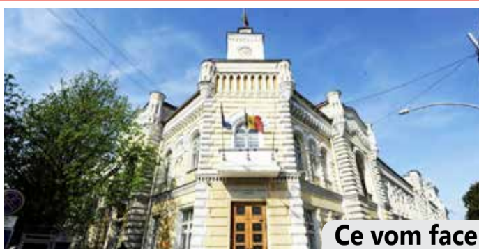
Ce vom face

Ce a reușit să facă fracțiunea PSRM în Consiliul Municipal Chișinău sub conducerea lui Ion Ceban în ultimii 3 ani.