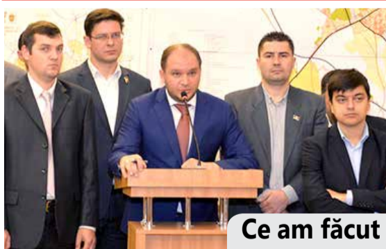
Ce am făcut

PARTIDUL SOCIALIȘTILOR DIN REPUBLICA MOLDOVA