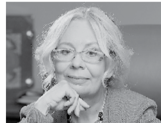
Татьяна ВАЛОВАЯ Министр по интеграции и макроэкономике ЕЭК

ЕАЭС СТРОИТ ЕДИНОЕ ПРОСТРАНСТВО ОТ ВЛАДИВОСТОКА ДО ЛИССАБОНА