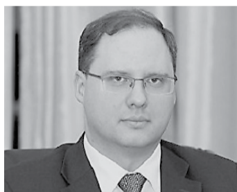
Алексей ГРУЗДЕВ Заместитель министра экономического развития Российской Федерации

ЕАЭС - ЭТО ВЗАИМОВЫГОДНО ДЛЯ СТРАН-ЧЛЕНОВ СОЮЗА